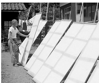
▲人間国宝岩野市兵衛 昭和44年8月29日 64146