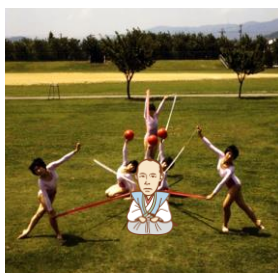
（背景）新体操 昭和56年8月16日 70697