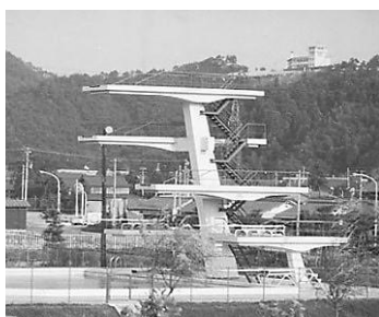
▲県営プール飛込み台 昭和45年8月26日 64693